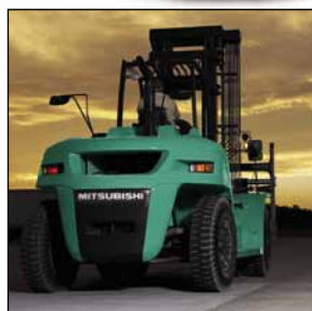
TREXIA EX Serie FD100-160N