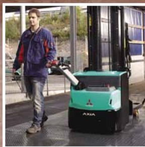
AXIA ES Serie SBP10-16N2