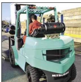
GRENDIA EX Serie FG40-50