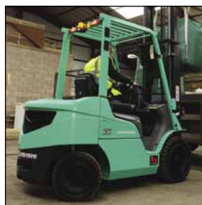
GRENDIA ES Serie FD15-35N