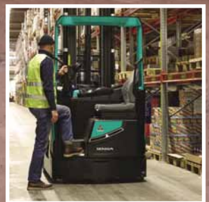
SENSIA EM Serie RB14-25N2