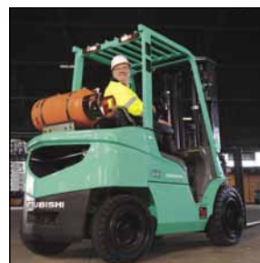
GRENDIA ES Serie FG15-35N