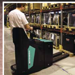
PREMIa EM Serie PBV20-25N2