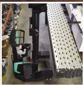
SENSIA EX Serie RBM20-25N2