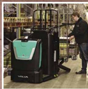
VELIA ES Serie OPB10-20NE