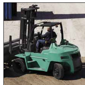
TREXIA ES Serie FD70N