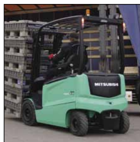
EDIA EX Serie FB25-25N