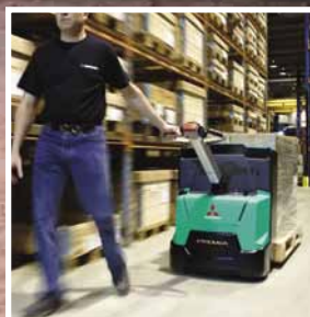
PREMIa ES Serie PBP16-20N2