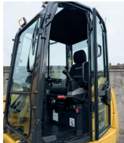
Nuova porta incernierata per una migliore accessibilità