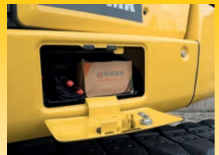
Generoso vano portaoggetti sotto la cabina