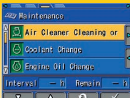
Monitor multifunzione per fornire all'operatore informazioni sullo stato di manutenzione

Il filtro olio idraulico originale Komatsu utilizza materiale filtrante ad alte prestazioni per lunghi intervalli di sostituzione, riducendo in modo significativo i costi di manutenzione.