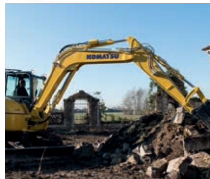
Valvole di sicurezza cilindri braccio e avambraccio