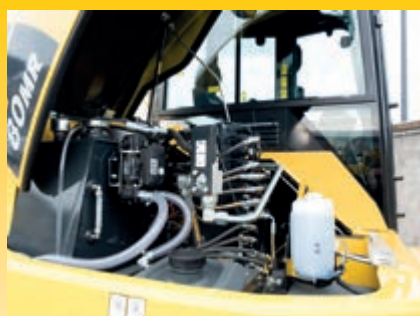
Migliorata accessibilità per la manutenzione