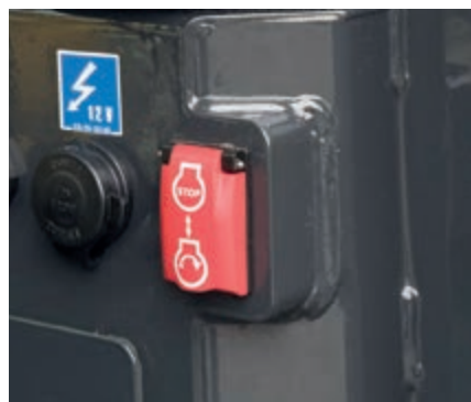
Interruttore secondario di spegnimento motore