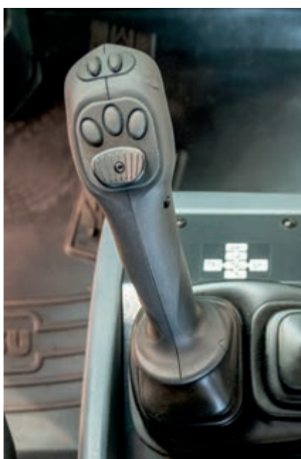
Leva multifunzione PPC con controllo elettronico opzionale per la terza e la quarta via (EPC)