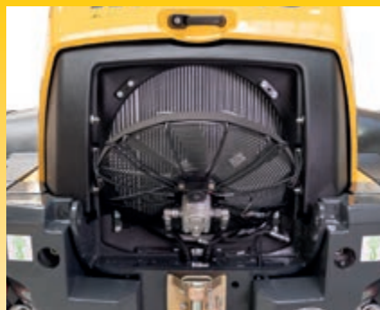
La ventola radiatore inclinabile facilita l'accesso per la pulizia