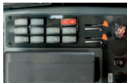
Comandi ergonomici perfezionati