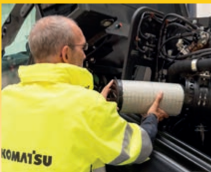
Accesso veloce, facile e comodo ai punti di manutenzione giornaliera