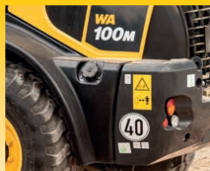
Velocità trasmissione idrostatica limitata a 40 km/h (optional)