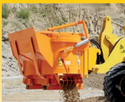
Versione High flow con portata max. di 120 l/min a 210 bar (optional)