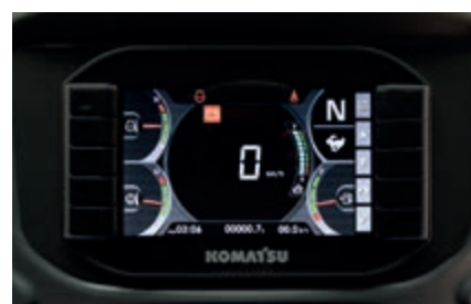
Grande monitor multifunzione