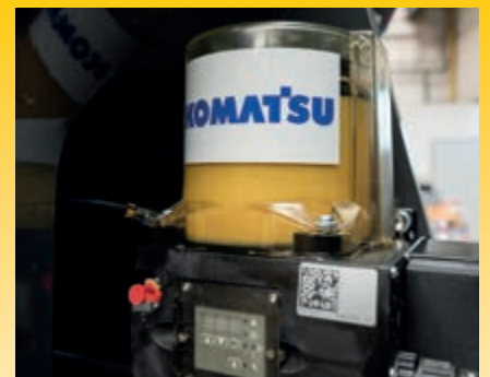
Il sistema di lubrificazione automatica montato in fabbrica riduce al minimo gli interventi giornalieri (optional)