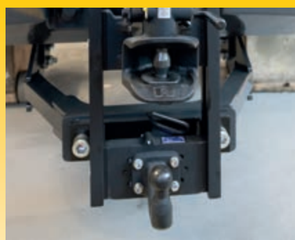
Collegamenti automatici regolabili in altezza del tipo a sfera (optional)